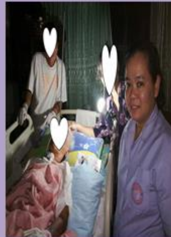
การติดตามเยี่ยมผู้ป่วยหลังจำหน่าย